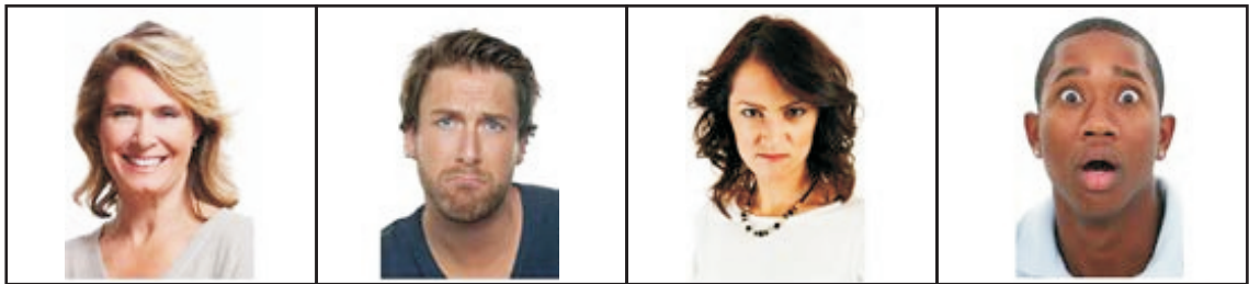
A B C D

04 (i) පහත රූප සටහනේ දැක්වෙන චිත්තචේත හඳුනාගෙන නම් කරන්න. (ල. 04)