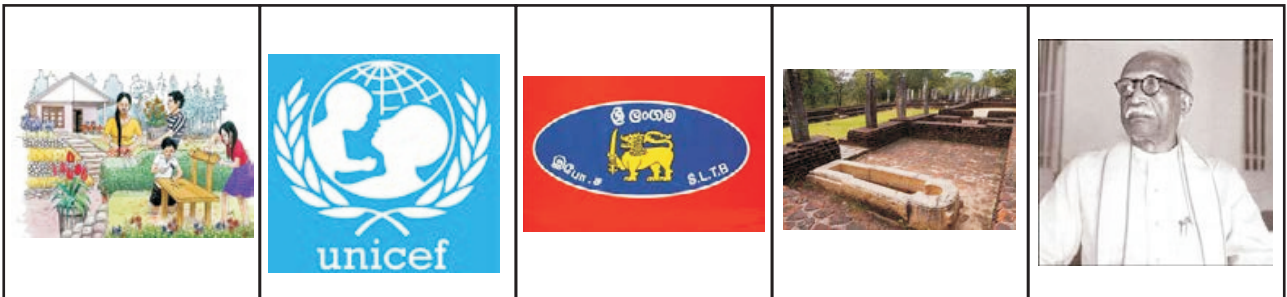
A B C D E