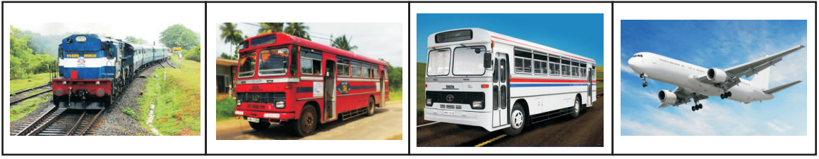
A B C D

(III) පහත පින්තූරයෙන් දැක්වෙන්නේ මගී ප්‍රවාහනය සම්බන්ධ මාධ්‍ය 4කි. එම ප්‍රවාහන මාධ්‍ය නම් කරන්න. (ල. 04)